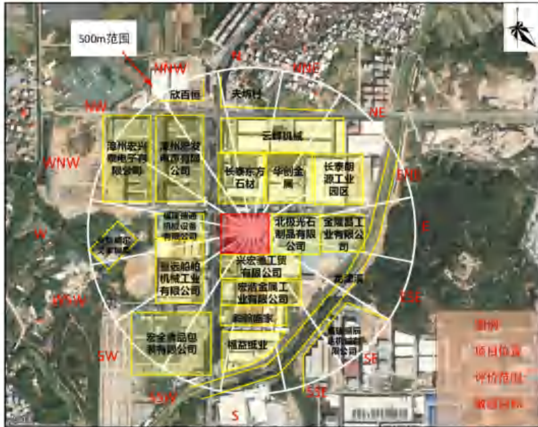
图 3-1 项目评价范围图

根据《福建鑫钰新材料有限公司年加工 10 万吨铅英中矿项目辐射环境影响评价专篇》，项目辐射环境影响重点考虑厂区周边 0.5km 范围内。项目评价范围图详见图 3-1。